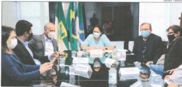
Governadora se reúne com representantes da Potiguar E&P para definir metas

A Governadora do Estado do Rio Grande do Norte Fátima Bezerra discutiu nesta quinta-feira (26) ações no setor de Petróleo e Gás com o CEO da Potiguar E&P, Marcelo Magalhães. A empresa assumiu o lugar da Petrobras em alguns campos de exploração e também venceu a Chamada Pública Coordenada para Aquisição de Gás Natural, realizada pela Potigás (RN), em conjunto com companhias de outros estados, para a compra de gás de novos supridores.