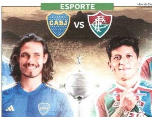
Cavani, do Boca Juniors, e Cano, do Fluminense farão duelo

VISTOSO FLUMINENSE OU A MÍSTICA COPEIRA DO BOCA?