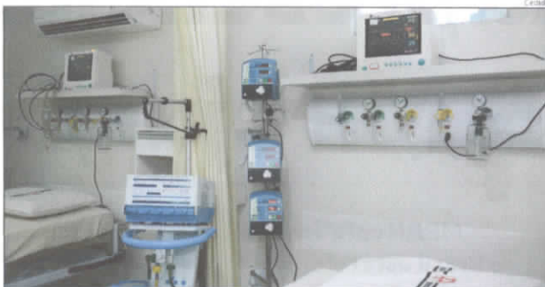
Mossoró tem 10 pessoas internadas, sendo somente quatro delas do município

A última vez que a Região Oeste teve percentual de ocupação de leitos igual ou acima de 40% foi no final de agosto. No dia 28 daquele mês a taxa de ocupação de leitos de UTI era de 40,74%. Em todo esse período, a ocupação dos leitos sempre fi-