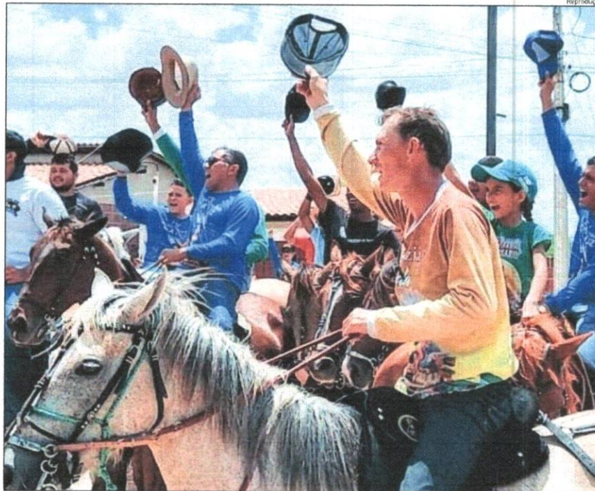
Saída ocorrerá às 16h da Capela de São Pedro, no conjunto Liberdade I

Conforme a organização, os participantes vão percorrer quase 10 quilômetros pelas ruas de Mos-