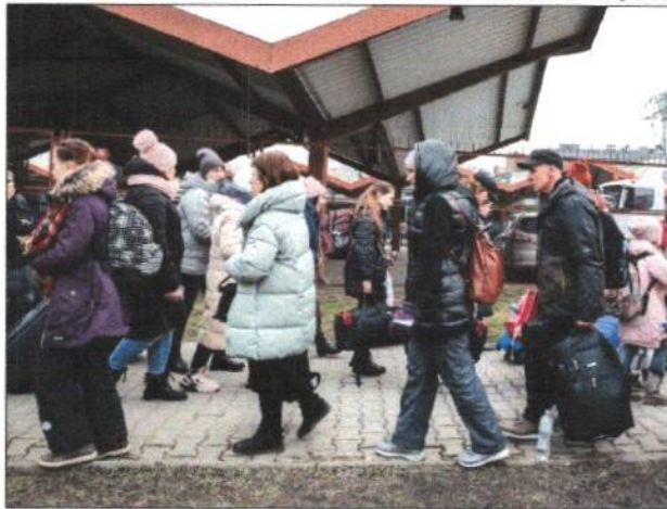
Civis fogem da guerra entre Rússia e Ucrânia

Os negociadores russos confirmaram que estão de acordo com a saída da população civil. "Concordamos que vamos manter corredores humanitários, vamos manter possibilidade de cessar-fogo nesses corredores humanitários e pedimos à população para que usem os corredores e esperamos que tudo acabe logo",