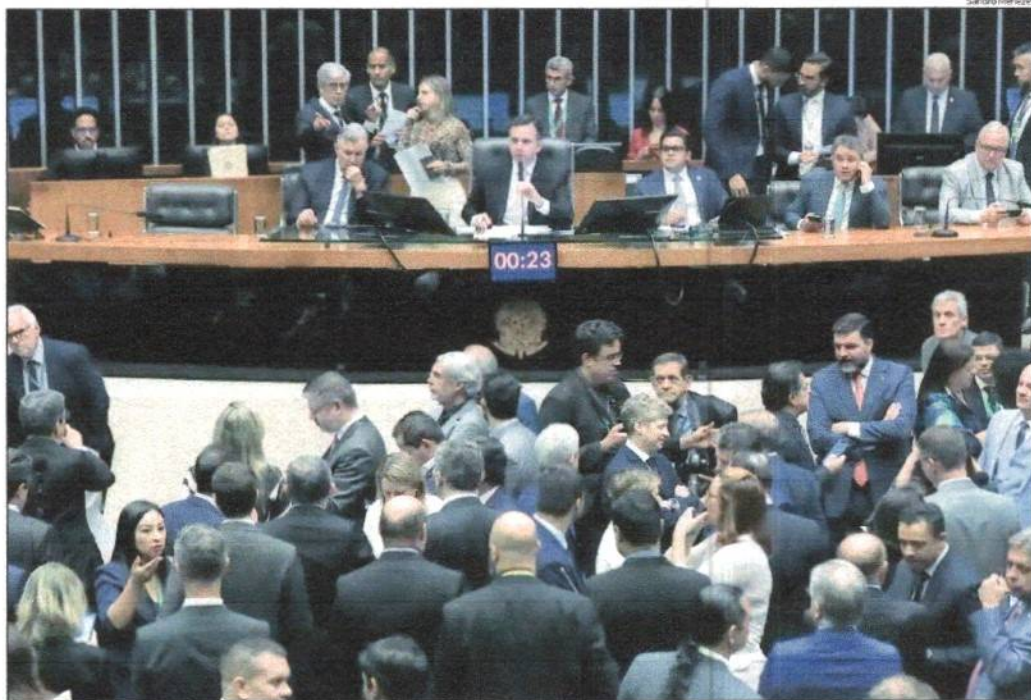
Em sessão conjunta do Congresso Nacional nesta quinta-feira, 14, senadores e deputados federais derrubaram o veto presidencial

Diretoria do Baraúnas organiza festa para apresentar o elenco e a taça de campeão do Estadual da Segundona. ESPORTES 8