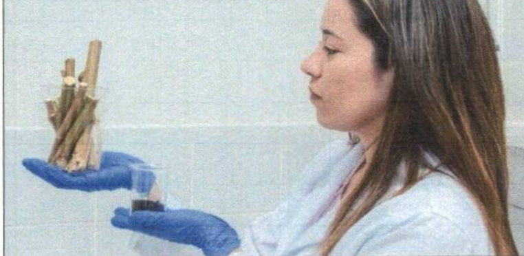
Pesquisas na Ufersa visam à redução de carbono e à descontaminação de água e solo