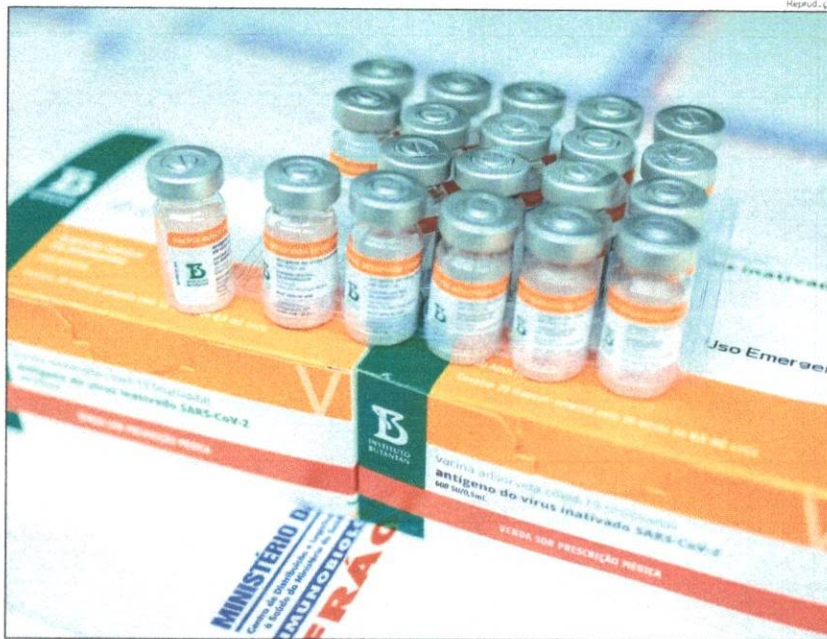
A medida aprovada pela Anvisa inclui na bula a faixa etária de 3 a 5 anos de idade

A autorização de uso emergencial da Anvisa permite que a faixa etária de 3