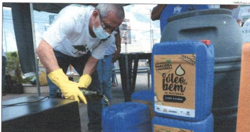
O acordo beneficia o Albem, instituição sem fins lucrativos que realiza um importante trabalho no estado