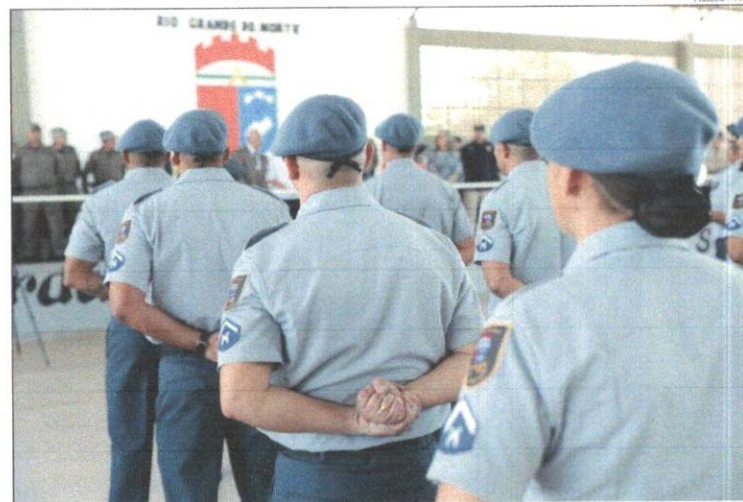
Concurso público vai reforçar os quadros da Polícia Militar do Rio Grande do Norte