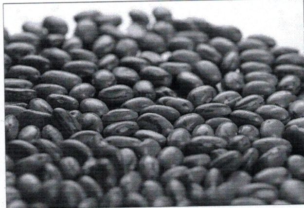
Feijão registra queda na variação de preço

Nos primeiros três meses do ano, o Nordeste mantém o maior crescimento no custo da cesta básica