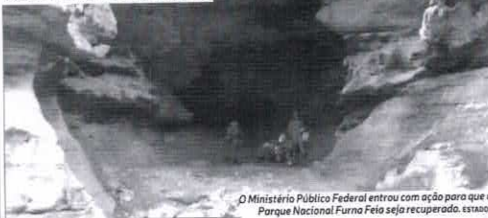
O Ministério Público Federal entrou com ação para que o Parque Nacional Furna Feia seja recuperado. ESTADO 3