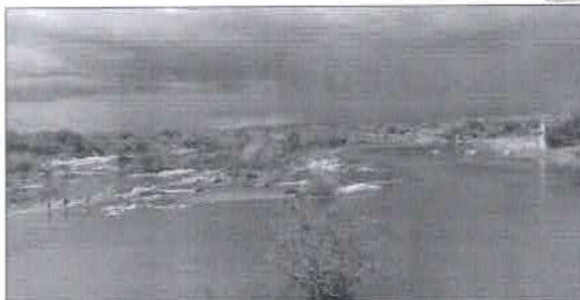
Chuvas intensas no interior do RN durante o período pós-carnaval devem ter continuidade

>> A previsão da Embrarn é de que as chuvas sejam frequentes até o início do mês de março em todas as regiões