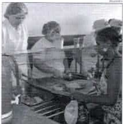
Restaurante Popular oferta 448 mil almoços mensalmente em suas unidades no RN