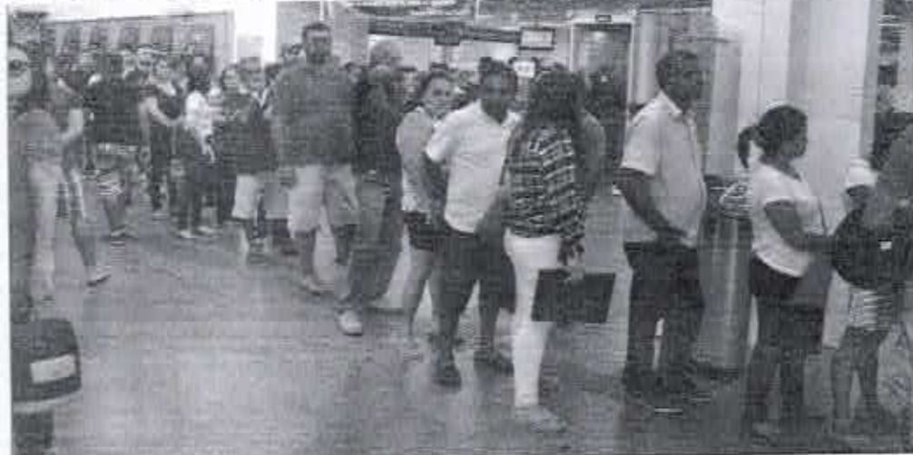
Trabalhadores lutam a agência central da Caixa Econômica Federal em Moissoró para sacar cotas do PIS. Muitas não tinham o direito ao benefício, o que acabou colaborando para superlotar a agência. MOSSORÓ 3