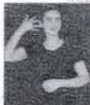
MPB orienta partidos políticos sobre uso de intérprete de libras

A banda Grafith é admirada por sua versatilidade. Adapta-se desde carnavais a festas de formatura de escolas, universidades e confraternizações.