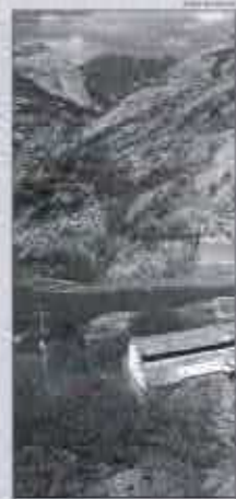
Motoristas enfrentam mais de 40 minutos para transpor o trecho da RN 404 invadido pelas dunas do Rosado. ESTADO 4