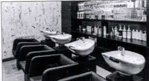
Serviços de cabeleireiros está entre os novos negócios que mais aparecem no RN