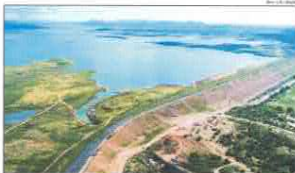
Barragem Armando Ribeiro está com quase 33% de sua capacidade total

Das 47 reservatórios, com capacidade superior a cinco milhões de metros cúbicos, monitorados pelo Igarn, 8 permanecem em volume morto, percentualmente, 17,02% dos manan-