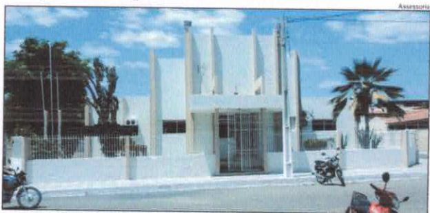
Prefeitura de Areia Branca segue orientação do MPRN sobre ponto eletrônico

Branca comunica o atendimento da notificação ministerial (a primeira recebida em maio de 2018 e a segunda que consta como ilustração desta postagem) e solicita a todos os servidores maior atenção aos seus horários, registrando sua entrada e saída nas máquinas de ponto eletrônico instaladas nos diversos locais de trabalho.