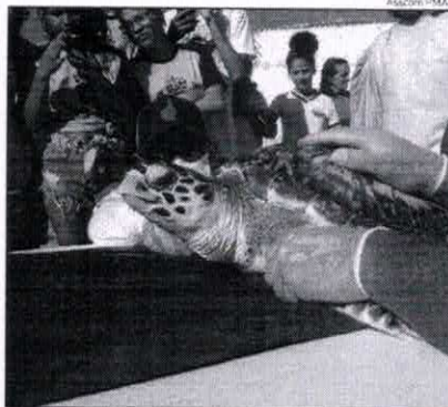
Alunos participando de soltura de tartarugas na praia de Redonda

A tartaruga ganhou o nome de "Maria Lúcia",